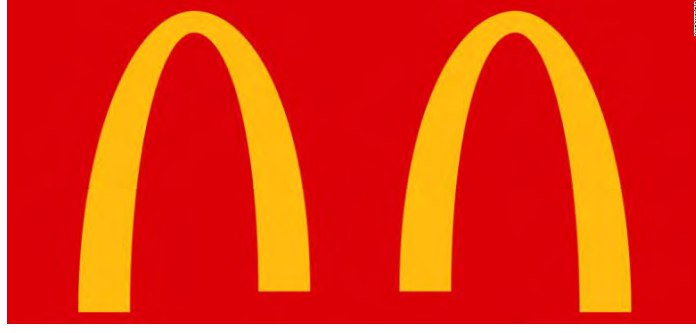
Şekil 8: McDonalds Covid-19 Logo Güncellemesi