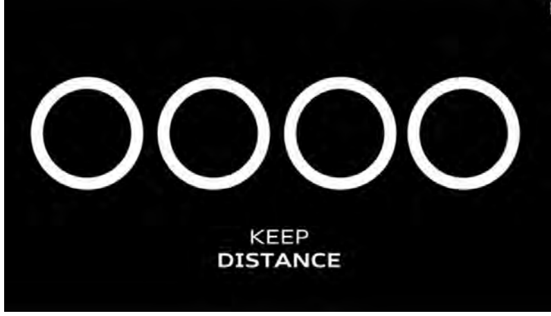
Şekil 4: Audi Covid-19 Logo Güncellemesi