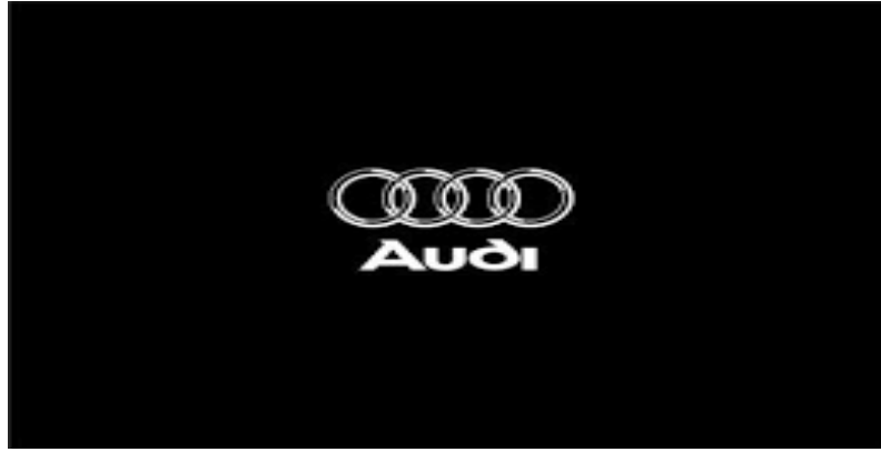
Şekil 3: Audi Logosu

Süreçte kısa sürede aktif olmuş bir diğer Alman otomobil markası Audi'dir. Latince "dinlemek" anlamına gelen Audi, 1910 yılında kurulmuş ilerleyen yıllar içerisinde dört farklı firmanın birleşimini ifade eden iç içe geçmiş halkalardan oluşan logosu ile geçmişten günümüze kullanılmaya başlanmıştır. Şekil 3'de markanın günümüzde kullandığı logosu yer almaktadır. Dört halkanın iç içe geçmiş hali, dört farklı markanın ortak ürettikleri arabada tek amblem olarak yer almasını temsil etmektedir 2 .