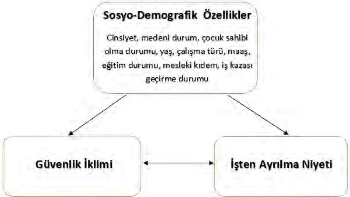
Şekil 1: Araştırmanın Modeli

Araştırmanın modeli şekil 1’de yer almaktadır.