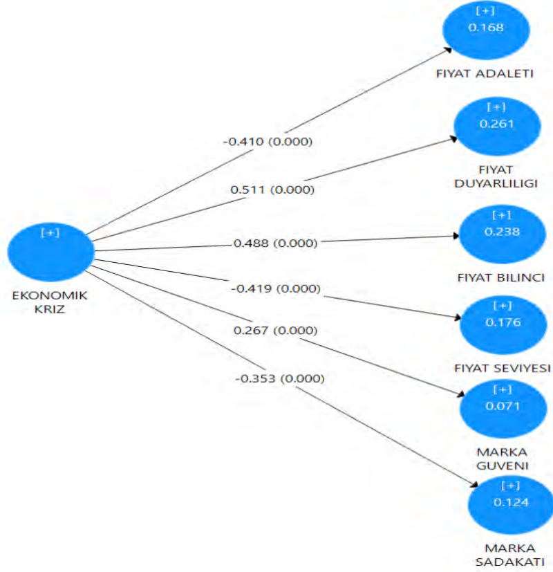
Şekil 2. Yapısal Modelin Yol Katsayıları ve Anlamlılık Değerleri