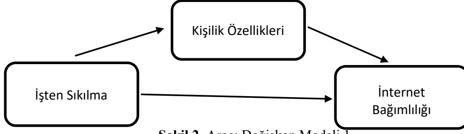
Şekil 2. Aracı Değişken Modeli 1