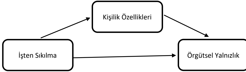
Şekil 4. Aracı Değişken Modeli 3